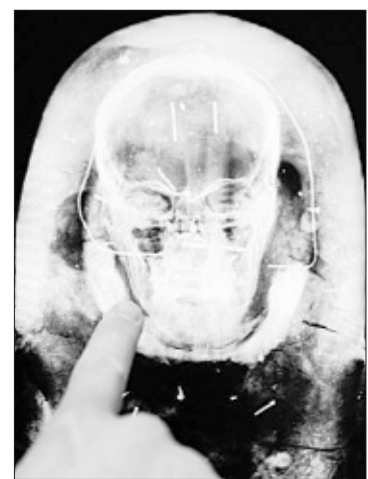
Escaneo de la momia.

La técnica por escáner permite seguir milímetro a milímetro las líneas de los huesos, incluyendo la dentadura, y lograr separa-