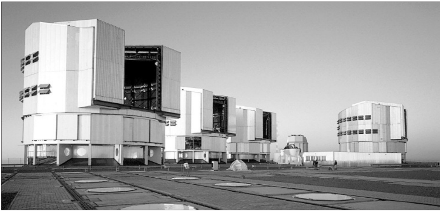
Los cuatro grandes telescopios europeos VLT, de 8,2 metros de diámetro, en Paranal (Chile).